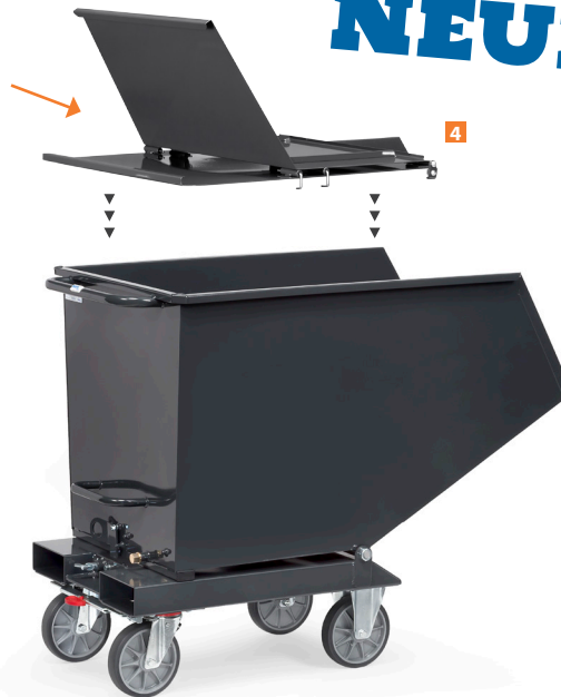
2 * Abbildung ohne Ablasshahn.