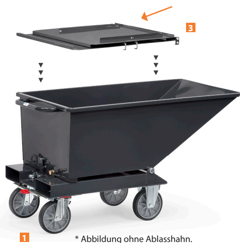
1 * Abbildung ohne Ablasshahn.