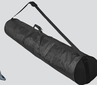
Tragetasche für Dreibein