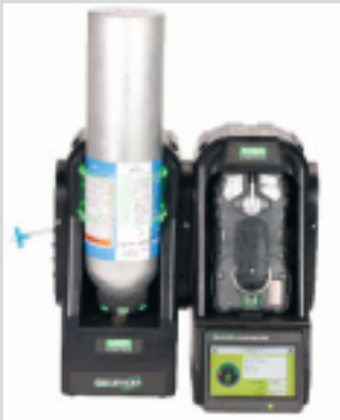
10128636 (Weitere Versionen erhältlich)