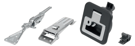
Spannverschlüsse, Schnappverschlüsse, Fallenverschlüsse