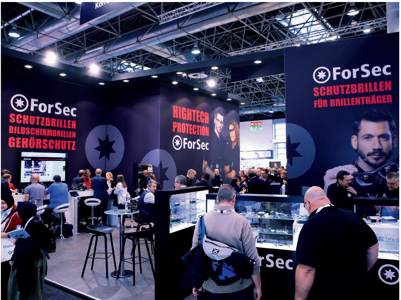
Gut besucht: der FAVORIT Stand auf der A+A

» Die Lieferanten sind mit der Geschäftsentwicklung im Produktionsverbindungshandel zufrieden «